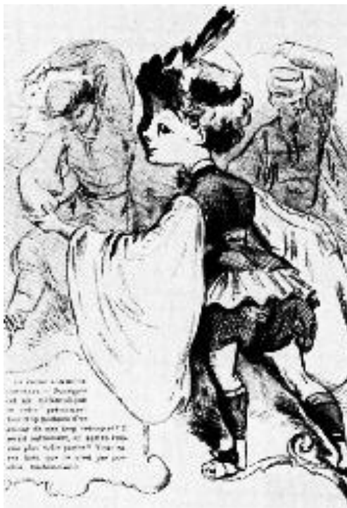
Eugénie Fiocre en travesti nella parte di Frantz. Caricatura di Emile Marcelin (1870).

aveva perduto le risonanze poetiche dell'era romantica, perdurava il culto della bellezza femminile, esaltata in mises inusitate e per di più in intriganti calzoncini.