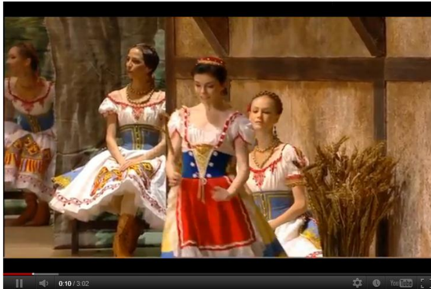
Natalia Osipova nella scena della spiga. Si osservi sempre su youtube l'interpretazione di Carlos Acosta e Marianela Nuñez con la compagnia del Royal Ballet di Londra http://www.youtube.com/watch?v=PQw0SUvIcx0&feature=fvwrrel

E poi la “ballade de l'épi”, simile all'analogica scena della margherita in Giselle . Un simbolo non da poco, vediamo perché: Swanilda porge a Franz la spiga, in segno di buon auspicio per le nozze volendo offrire sia il seme che il nutrimento. I giovani si pongono in ascolto per udire il responso; ma Franz non sente nulla, al contrario di un amico che pretende di sentire distintamente