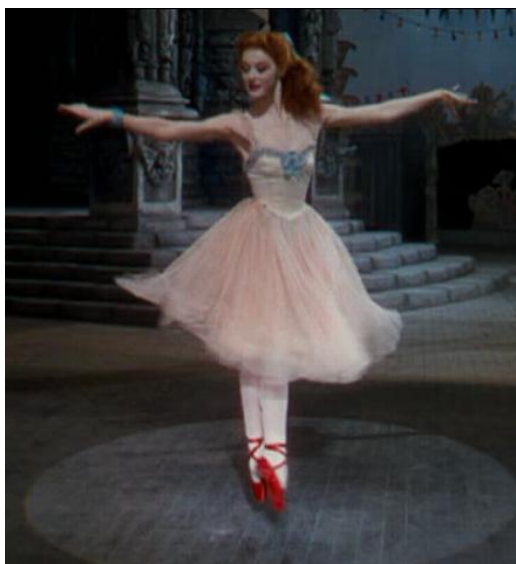
Moira Shearer in Scarpette rosse .

Commedia parigina par excellence , la creazione promossa dal Théâtre de l'Opéra nel 1870 di Coppélia ou La Fille aux yeux d'émail resta imprescindibile punto di partenza per ricostruzioni o remake , che ci sembra soddisfare un bisogno di piacevolezza in un contesto storico caratterizzato da gravi conflitti tra i paesi europei. Paure del dissidio esorcizzate celebrando la joie de vivre della nascente metropoli cosmopolita – ed europea – mediante danze polacche, ungheresi, e il galop dei salons parigini. L'Europa degli accordi, della Spiga e della Pace alla quale aspiriamo ancora.