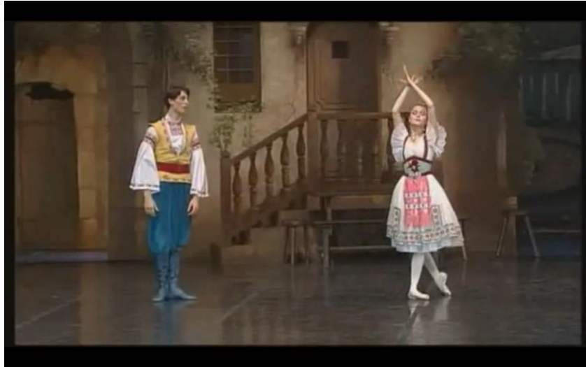
Franz e Swanilda nella versione Lacotte per la scuola di ballo dell'Opéra di Parigi http://www.youtube.com/watch?v=uT43Ow5L7rY&feature=related

sostituendo o tagliando in primo luogo le scene pantomimiche: ad esempio, al primo atto, quelle della farfalla inseguita da Franz, trafitta e poi applicata al colletto.