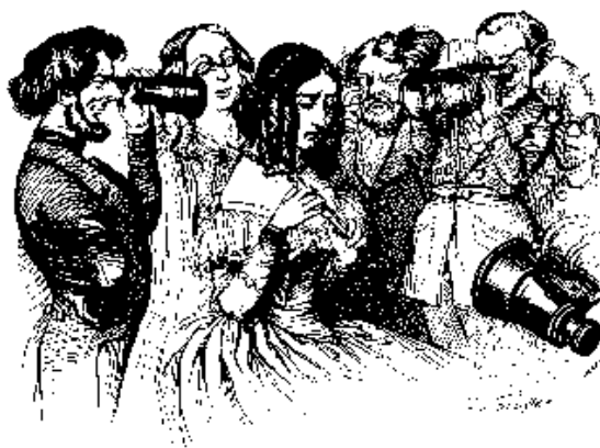
L'illustrazione del testo di Hoffmann è di Paul Gavarni (1804-1866) http://www.has.vcu.edu/for/hoffmann/sand_pics.html

Divenuto ormai studente, Nathaniel crede di riconoscere la figura spaventevole della sua infanzia in un ottico ambulante italiano, Giuseppe Coppola, che nella città universitaria gli offre in vendita degli occhiali da sole e, al suo rifiuto, ribatte: «Ah, niente occhiali, niente occhiali! ... ho anche begli occhi, begli occhi!». Il raccapriccio dello studente si placa allorché gli “occhi” che l'ottico gli offre si rivelano innocui occhiali da vista. Egli compra da Coppola un cannocchiale tascabile e con questo comincia a scrutare nella casa di fronte, dove abita il professor Spalanzani e in cui scorge la bella figlia di costui, Olimpia, misteriosamente laconica e immobile. Ben presto se ne innamora così ardentemente da dimenticare la sua saggia e prosaica fidanzata [Clara]. Ma Olimpia è un automa nel quale Spalanzani ha inserito il meccanismo e Coppola – il mago sabbiolino – gli occhi. Lo studente arriva mentre i due stanno litigando per la loro opera. L'ottico è riuscito a impossessarsi della bambola di legno priva degli occhi, e il meccanico, Spalanzani, getta sul petto di Nathaniel gli occhi sanguinanti di Olimpia che giacevano al suolo, e dice che Coppola li ha rubati a lui, Nathaniel. Costui viene colto da un nuovo attacco di follia [...].