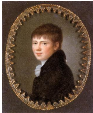
Heinrich Wilhelm von Kleist

E per contro questa linea, da un altro lato, è qualcosa di molto misterioso. Essa non è infatti se non il "cammino dell'anima del danzatore" ; ed egli manifestava il dubbio si potesse trovare altrimenti che se il macchinista si trasponga nel centro di gravità della marionetta, cioè, in altre parole, "danzi" 21 .