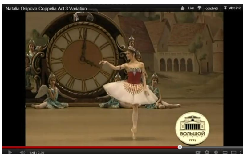
Natalia Osipova nella variazione del III atto di Coppélia (Teatro Bolshoi)

Commedia parigina par excellence , la creazione promossa dal Théâtre de l'Opéra nel 1870 di Coppélia ou La Fille aux yeux d'émail resta imprescindibile punto di partenza per ricostruzioni o remake , che ci sembra soddisfare un bisogno di piacevolezza in un contesto storico caratterizzato da gravi conflitti tra i paesi europei. Paure del dissidio esorcizzate celebrando la joie de vivre della nascente metropoli cosmopolita – ed europea – mediante danze polacche, ungheresi, e il galop dei salons parigini. L'Europa degli accordi, della Spiga e della Pace alla quale aspiriamo ancora.