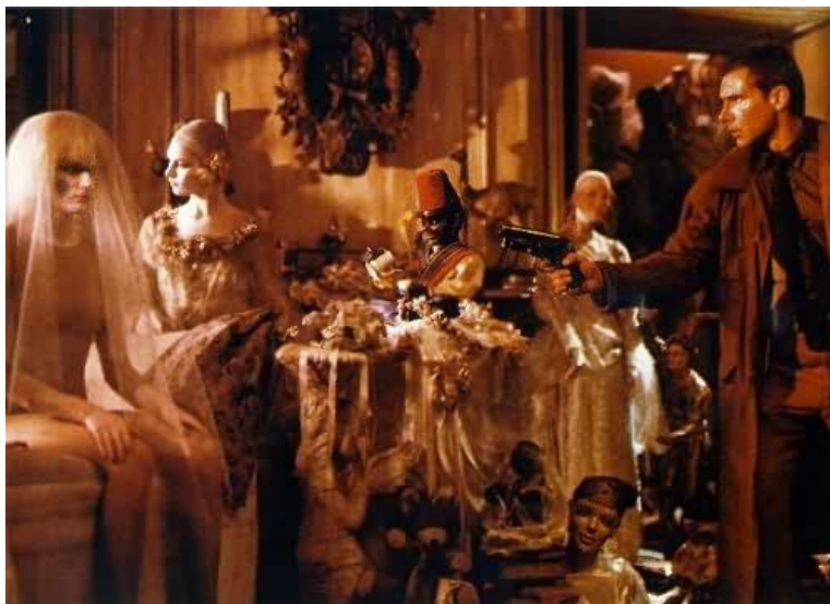
Harrison Ford, Blade Runner (l’appartamento di Sebastian).

È assente Nathanael (sostituito da un aitante e ingenuo Franz) nelle coreografie di repertorio. Le riletture novecentesche evocano a volte gli incubi o le meraviglie di automi, androidi, cloni e replicanti. Simulacri dell’umanità o dispositivi meccanici in grado di riprodurre i movimenti e l’aspetto esterno dell’uomo, si propongono come retaggio animistico o questione psicoanalitica, ultimo confine della scienza o aspirazione legittima dell’uomo a forme sempre nuove di vita: More Life , come recita la sceneggiatura di Blade Runner . More human than human 7 .