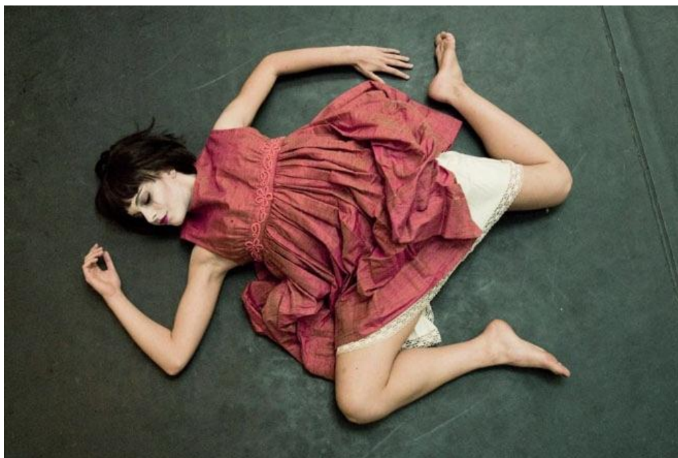
Coppelia, “balletto con drammaturgia, regia e coreografia” di Fabrizio Monteverde http://www.youtube.com/watch?v=7zGzcHqB5Ns

un jeu cruel de l'amour: la jeune fille est aimée par un homme vieux ou disgracié [...] mais finalement elle lui préférera un jeune homme beau et sans esprit. [...] c'est le thème de la manipulation. Ainsi Copélius [ sic ] rêve d'animer la poupée, d'en faire l'objet de sa passion 6 .