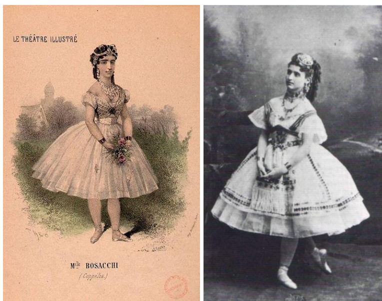
Giuseppina Bozzacchi, Coppélia (1870).

Nel secolo del primato della scuola italiana e dell'accademia scaligera voluta da Carlo Blasis erano sovente italiane le prime interpreti dei balletti nei