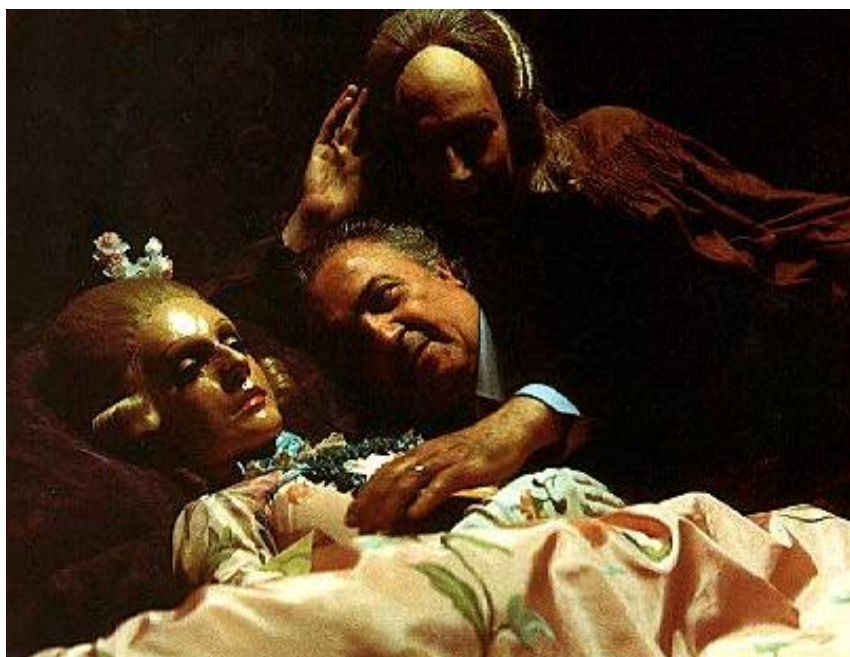
Fellini e la bambola durante le riprese del film Casanova (1976). Per la scena interpretata della bambola danzante (la ballerina Leda Lojodice) vedi: http://www.youtube.com/watch?v=zPE-c43cOGc

di scaltri venditori di elisir d'amore, di scienziati folli, di iniziati e guaritori in possesso di arcani segreti 3 .