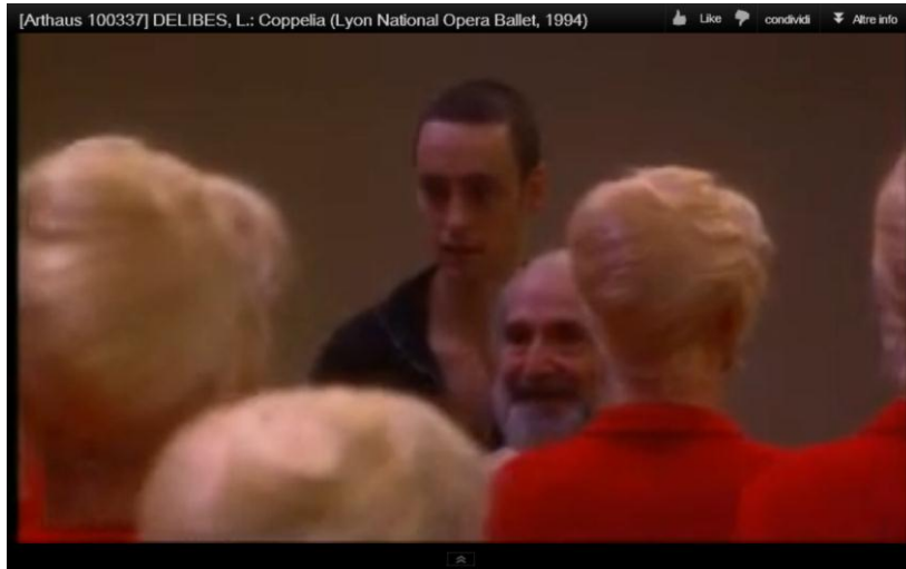
“Valse de la Poupée”, Coppélia, Opéra de Lyon: http://www.youtube.com/watch?v=Qs3nLz7zufU

È assente Nathanael (sostituito da un aitante e ingenuo Franz) nelle coreografie di repertorio. Le riletture novecentesche evocano a volte gli incubi o le meraviglie di automi, androidi, cloni e replicanti. Simulacri dell’umanità o dispositivi meccanici in grado di riprodurre i movimenti e l’aspetto esterno dell’uomo, si propongono come retaggio animistico o questione psicoanalitica, ultimo confine della scienza o aspirazione legittima dell’uomo a forme sempre nuove di vita: More Life , come recita la sceneggiatura di Blade Runner . More human than human 7 .